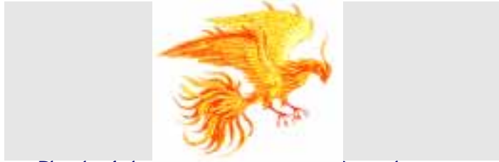
Plancha de la Gran Logia de Lengua Española para Canadá, Respetable Logia Libertadores Nº : . 2

« La vida está sometida al principio de degradación Y de desintegración universal Pero también al principio de regeneración »