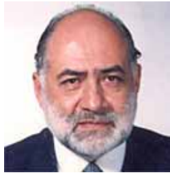
por Ramón Armando Garzón Mendoza : .

Cada período de tiempo milenario el símbolo del Ave Fénix* implica volver a regenerarse, generándose de las cenizas—a su vez símbolo de purificación—por el fuego del Ser interno humano, al “recibir” la vibración pura originaria del universo (y su singularidad discontinua).